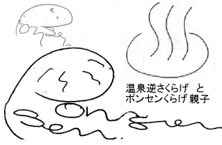
温泉逆さくらげと ポンセンくらげ親子

オンセン(温泉)の間違ひではありません。ポンセンすなわち食べるもので、私の育ったところではポンせんべいの略でポンセンと呼ばれていました。このポンセンを焼く機械を以前に会社で開発、設計、製作、販売と5年ほどかかったことがあり、これにまつわるいろんな面白い話が各段階にいっぱいあるのですが今回はその紹介を。